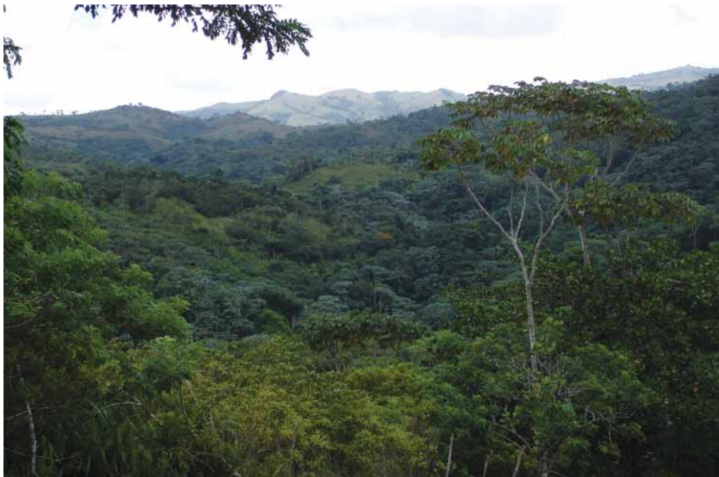
Forêt de feuillus humide aux altitudes moyennes de la Cordillera Septentrional, en République dominicaine.

Le Comité consultatif du FPHGB est composé de représentants de VCE, de l'Adirondack Nature Conservancy, de l'Adirondack Council, d'Audubon New York, de la Wildlife Conservation Society et de la Fundación Loma Quita Espuela. Son rôle consiste à conseiller l'ACT pour