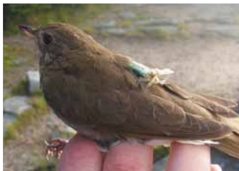
Une Grive de Bicknell munie d'un géorécepteur solaire.

Comprendre le moment et l'étendue des contraintes chez les populations d'oiseaux est rendu