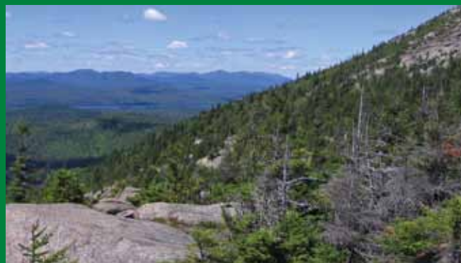
Habitat typique de nidification de la Grive de Bicknell en forêt de montagne.