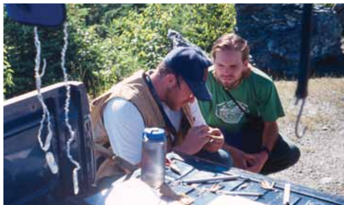
Le baguage de Grives de Bicknell permet de recueillir des données importantes sur l'histoire naturelle et l'écologie de l'espèce.